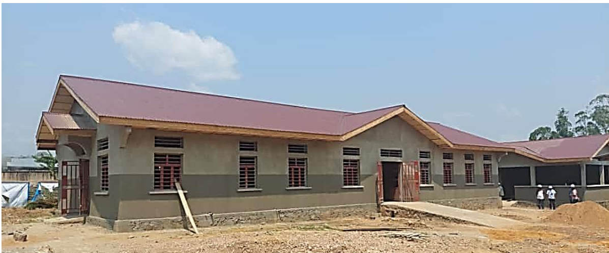
Photo : Centre de santé Pakanza, Commune rural d'Oicha, Territoire de Beni/Nord-Kivu

Des coûts des ouvrages ont été fixé de manière aléatoire et en violation des articles 46 et 49 du Décret portant manuel des procédures de la Loi relative aux marchés publics. D'après le document programmatique, la construction et équipement d'un Centre de Santé est de 218 000 Usd, la réhabilitation coûte 150.000 $; 257 000 Usd pour la construction d'une école de 6 salles de classe et sa réhabilitation est fixées à 150.000 $. Le budget de 200 000 Usd est arrêté pour un bâtiment administratif 33 . L'absence des études préalables à la commande publique font plomber les doutes sur l'exactitude des budgets arrêtés. Ces budgets paraissent irrationnels, selon les témoignages des anciens experts des Ministères de la santé et de l'enseignement